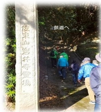
佐東山 岩井寺霊場