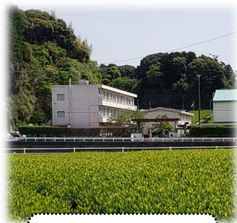
創立150周年を迎える 上内田小学校

令和5年度協議会は区長会・学習センター・福祉協議会と今まで以上に連携を密にし、様々な事業についてメンバー丸となって鋭意取り組んでいきます。