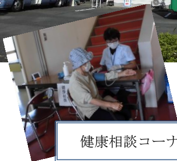
健康相談コーナー