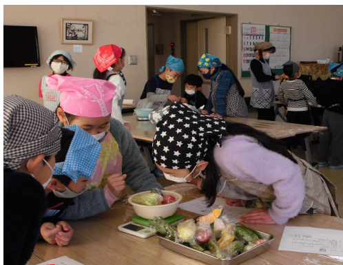
重さを確かめる子どもたち

調理前の説明ではコーラの中の糖分の多さ見びっくりしたり、野菜を食べることの大切さに頷いたりと真剣なまなざしで聞き入っていました。