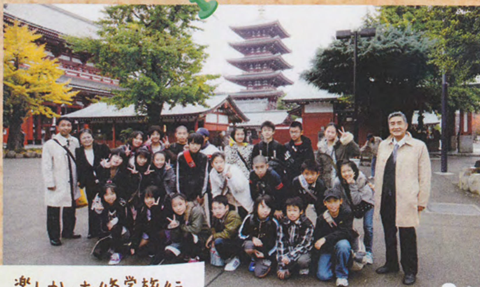
楽しかった修学旅行