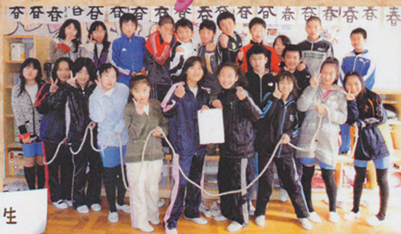
大きくなったね6年生