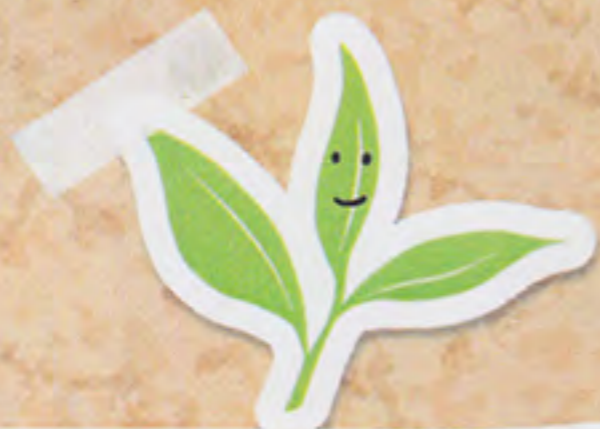
お茶摘み体験学習