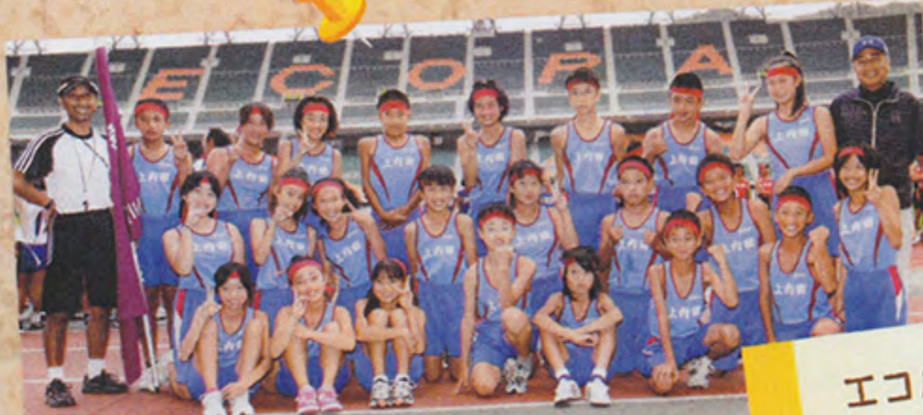
エコパでの陸上大会