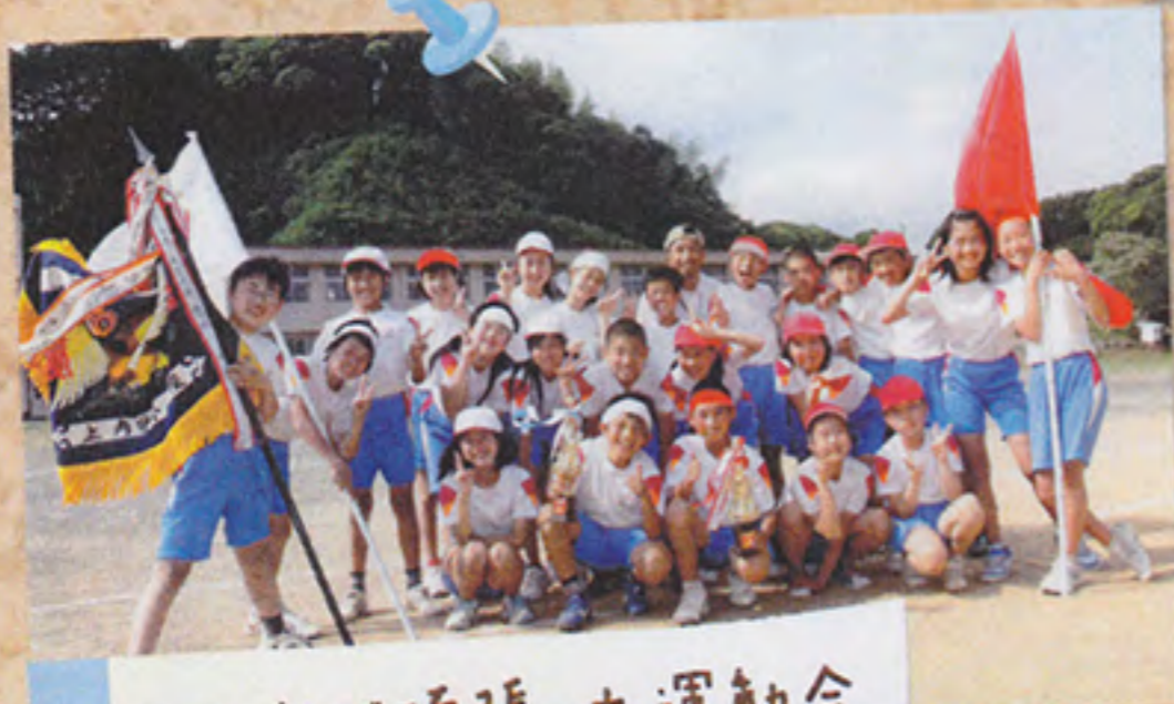
みんなで頑張った運動会