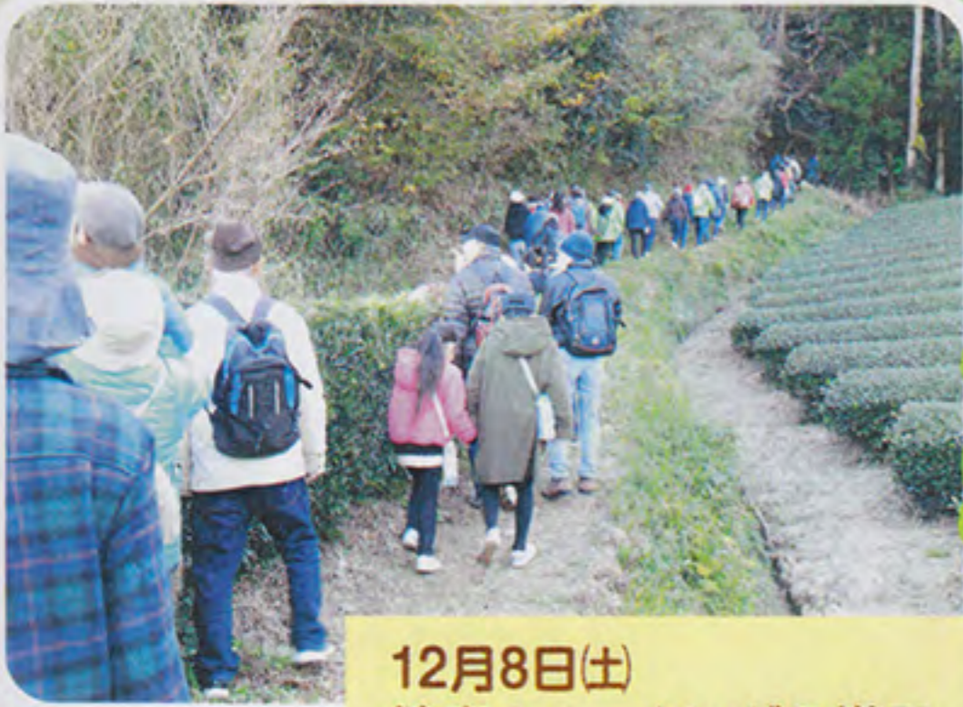
12月8日(土) 健康ウォーキングの様子