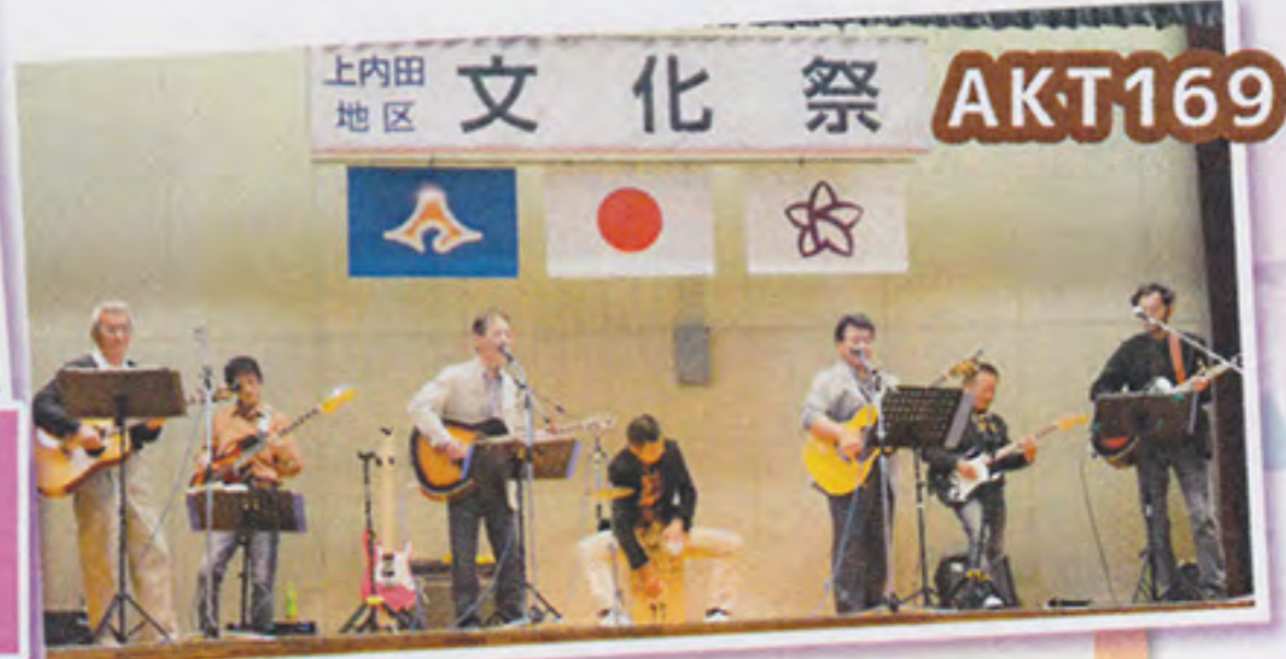
掛川工業高校ギター一部