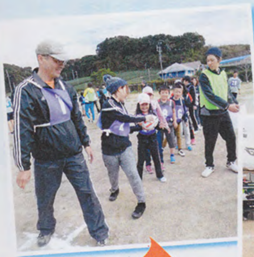
ラグビーボール 送り

11月4日(日)、晴天に恵まれ盛大に体育大会が行なわれました。今年はラグビーボール送りが新しく種目になりました。朝から多くの人達が体を動かして気持ちの良い一日でした。