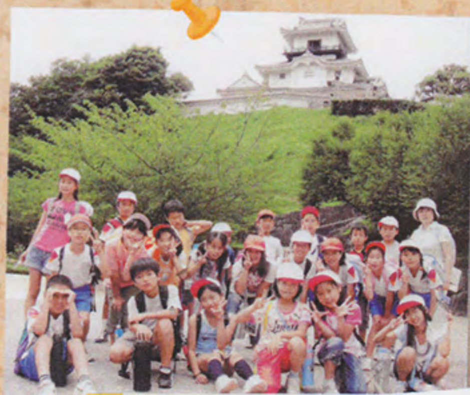
春の遠足で掛川城